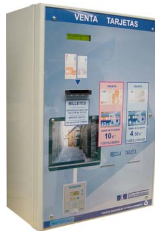
EXPEND - 4