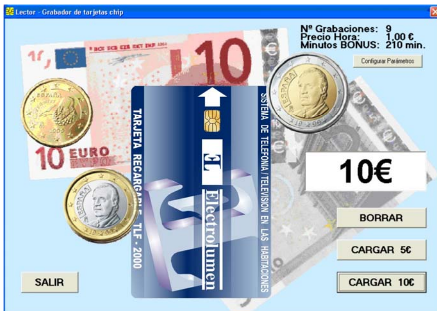
Pantalla programa informático

El conexionado al PC es mediante una conexión USB. El programa es capaz de reconocer la existencia del grabador específico y configurarse según se haya inicializado el puerto, por lo que no es preciso hacer ninguna configuración.