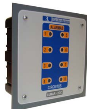
LUMAR - 2DC

El LUMAR-2DG-R es un vigilante digital de aislamiento que se integra en el conjunto de la instalación de un sistema de alimentación aislado tipo IT, para usos médicos que comprende además un transformador separador, elementos de protección y conexiones equipotenciales a tierra de protección.