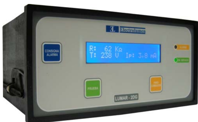
LUMAR - 2DG