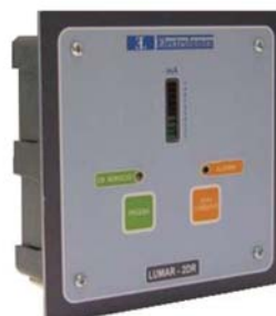
LUMAR - 2DR